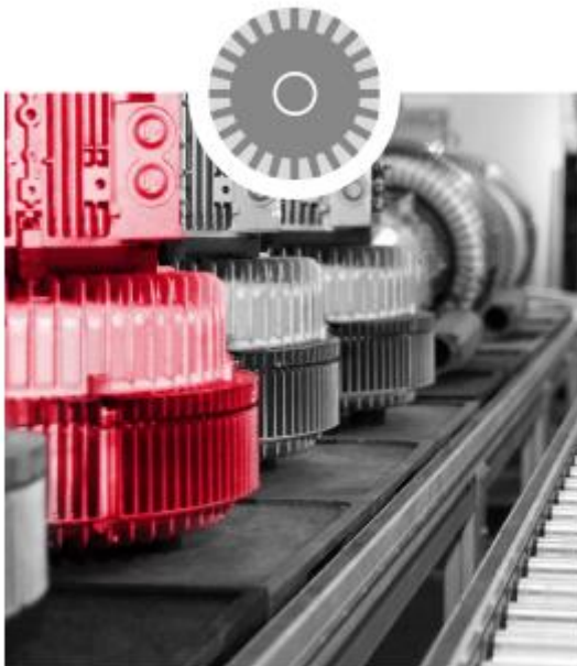
SÉRIE G - CANAL LATÉRAL