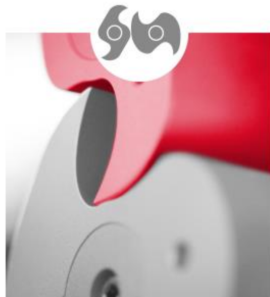
SÉRIE C - À GRIFFES