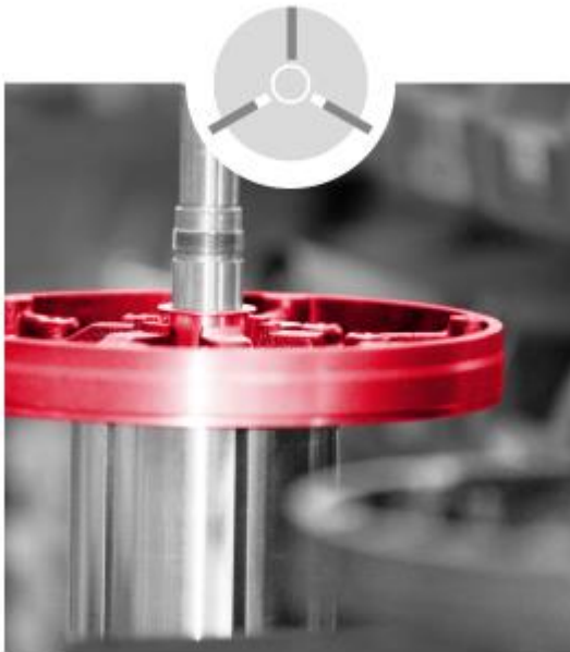
SÉRIE V - PALETTES ROTATIVES